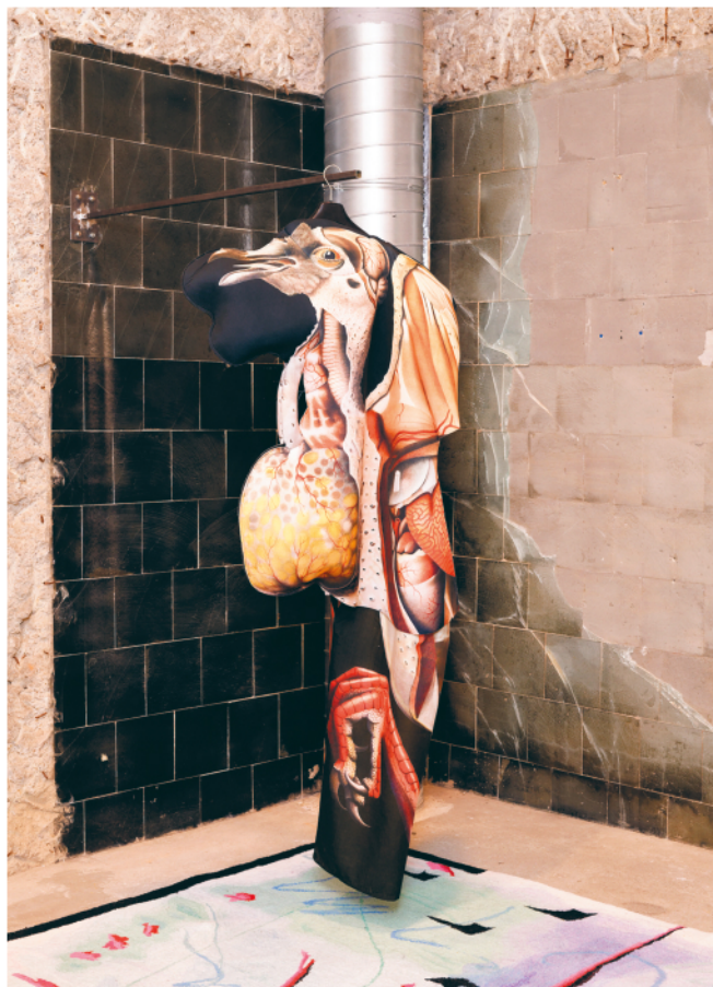
INES DOUJAK PIGEON , 2018 Mixed media, dimensions variable Installation view / Installations- ansicht, Centre d'Art Contemporain Passerelle, Brest