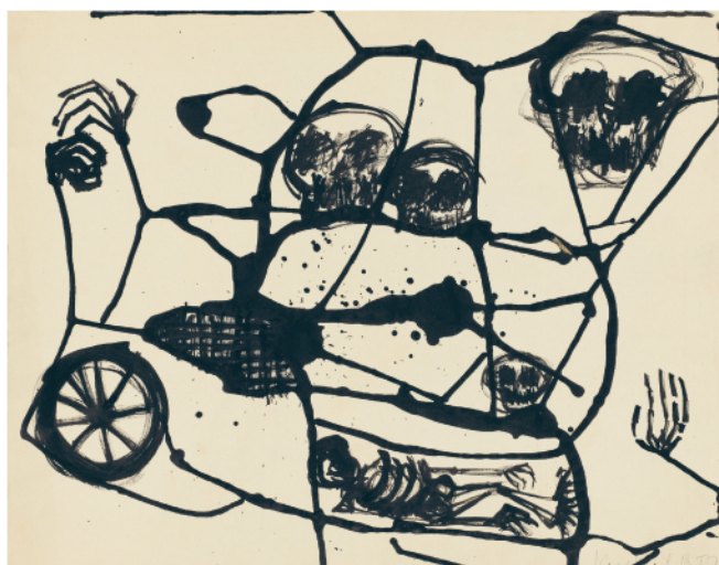
KIKI KOGELNIK UNTITLED (SKELETON) , 1957 India ink on paper 40.3 x 51 cm Courtesy Kiki Kogelnik Foundation © 1957 Kiki Kogelnik Foundation All Rights Reserved