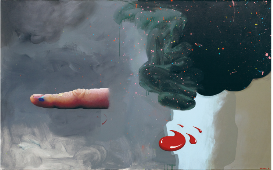
ASHLEY HANS SCHEIRL OFFSHORE CREATIVITY, 2016

Acrylic on canvas / Acryl auf Leinwand, 125 x 200 cm