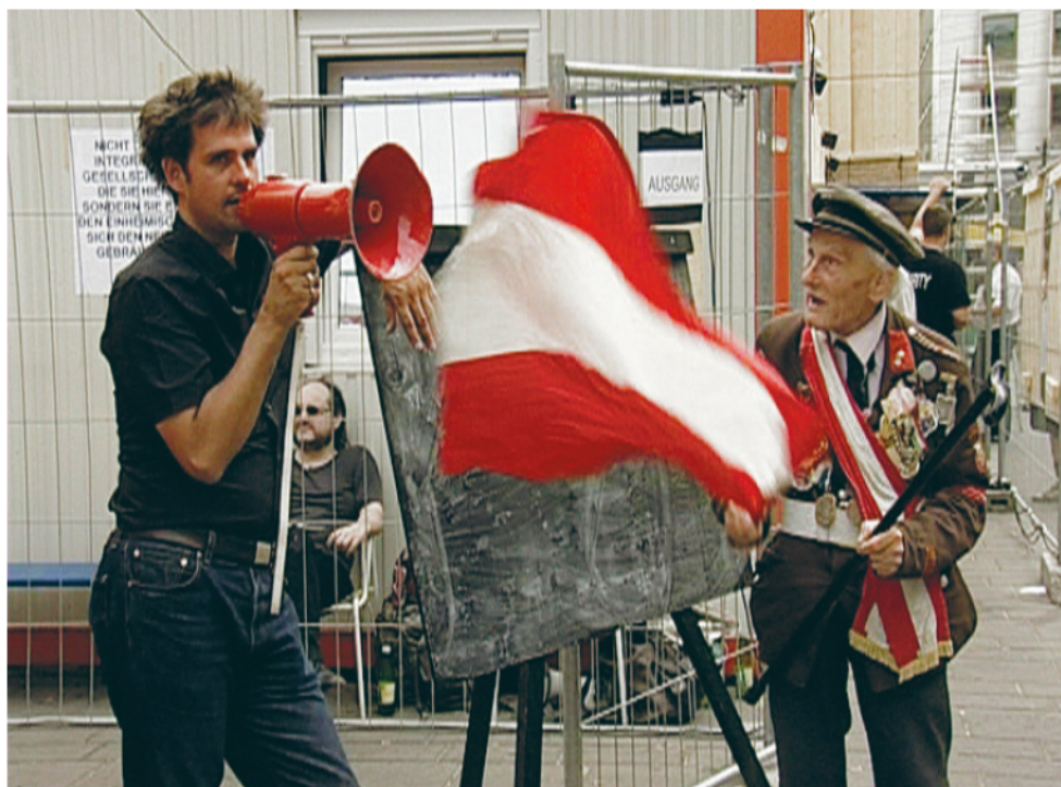
CHRISTOPH SCHLINGENSIEF AUSLÄNDER RAUS! SCHLINGENSIEFS CONTAINER, 2002