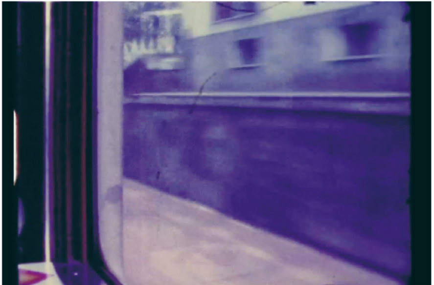
NIL YALTER ORIENT EXPRESS (PARIS-ISTANBUL), 1976 Filmstill, 8 mm-Film, Farbe, 14' 30"