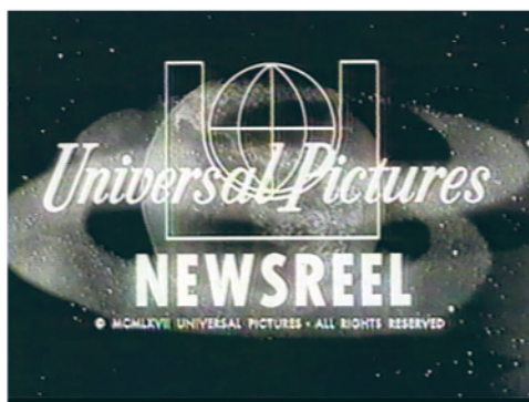
TONY COKES BLACK CELEBRATION, 1988