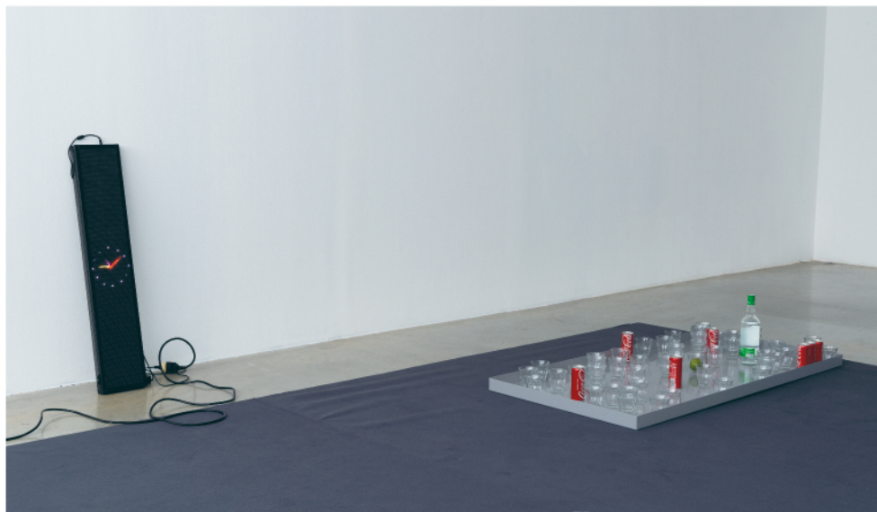
NOAH BARKER DECOMMISSIONED CUBA LIBRE ASSEMBLY LINE, 2018

Programmed led-sign, powder-coated steel tray, Rum, Coke, limes, Duralex glasses programmiertes LED-Zeichen, pulverbeschichtete Stahlablage, Rum, Coke, Limette, Duralex-Glas, dimensions variable