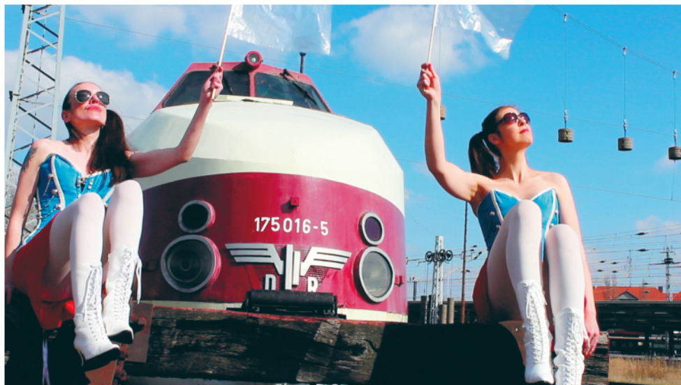
FORM FUTURE JUMP JUMP, 2014