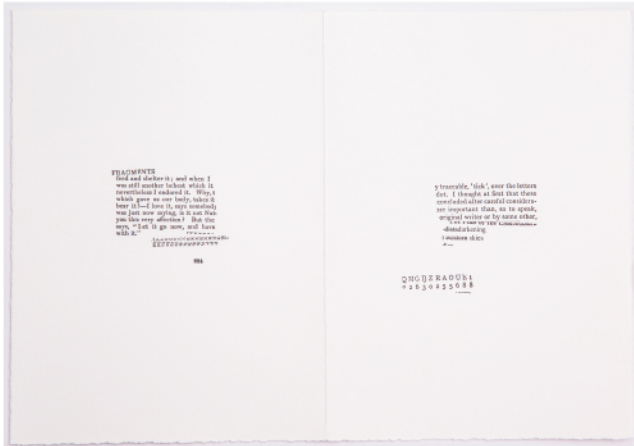
SUSAN HOWE from the series / aus der Serie CONCORDANCE , 2018 Typewriter on hand-made paper / Schreibmaschine auf Büttenpapier Courtesy Christine König Galerie, Vienna / Wien and the artist / und die Künstlerin