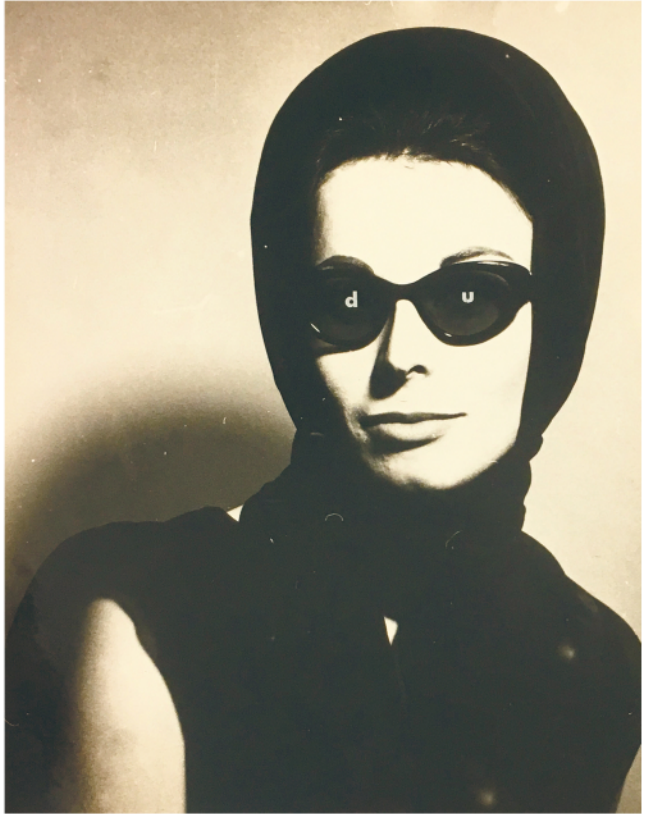
GERHARD RÜHM UNTITLED / OHNE TITEL, 1965 Collage on photography / Collage auf Fotoabzug 30,5 x 24 cm Courtesy Christine König Galerie, Vienna / Wien and the artist / und der Künstler