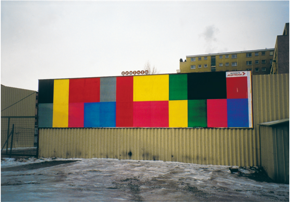
GERWALD ROCKENSCHAUB AUSTRIAN AIRLINES POSTER CAMPAIGN, 1991 museum in progress, Vienna