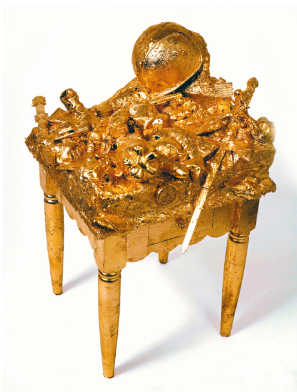
JOHN MILLER VERLIEBT IN BERLIN, 2007 Gold leaf, plaster, paper maché, styrofoam, plastic objects on table 91.4 x 76.2 x 50.8 cm