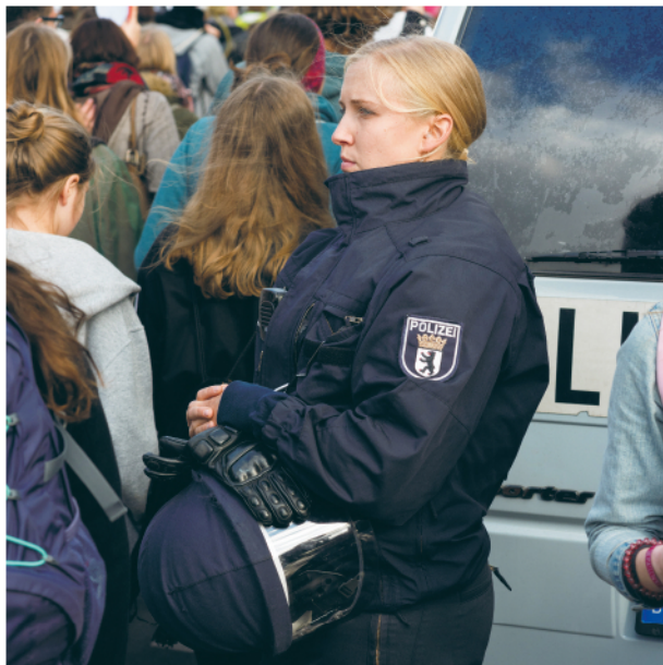
ILYA LIPKIN UNTITLED, 2018 Digital C-print (w/ 50 cm x 50 cm image square) on Fujifilm Chromira Prolab Matte paper, 74 x 74 cm, Edition of 3 + 1 AP Courtesy of the artist and Svetlana Gallery NY