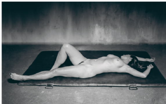
ELFIE SEMOTAN NUDES 1, WIEN 2012 Platinum Palladium Print 16 x 24 cm Ed. of 3 + 1 AP