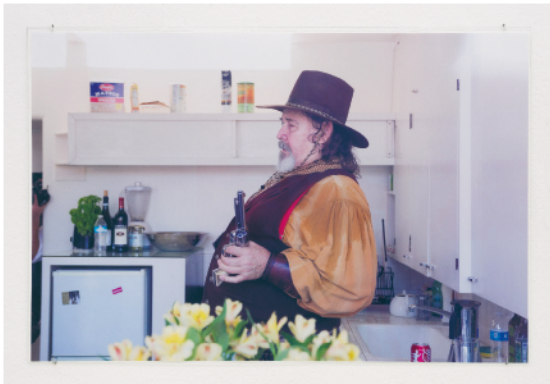
KATHI HOFER CREEK, 2017 C-Print, Glas, Eisen 65 x 98 cm Ed. of 3 + 2 AP