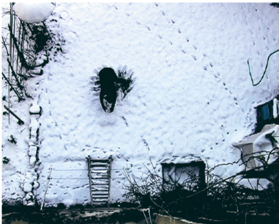
JOHANNA REICH BLACK HOLE, 2009 SD Video, Pal, Stereo 1:50 min Courtesy Galerie Priska Pasquer © Johanna Reich @ VG-Bildkunst Bonn