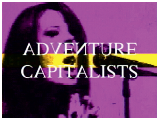
Ad Vice 1999 Tony Cokes

Single-channel colour video, sound, 6:36 min