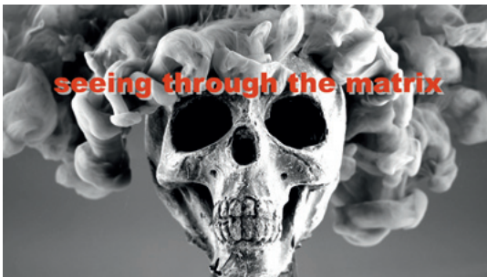
Like a Pig in Shit 2019 (Detail)

Single-channel, B&W and colour video, sound, 3:53 min Video still courtesy of Branda Miller and Electronic Arts Intermix (EAI), New York