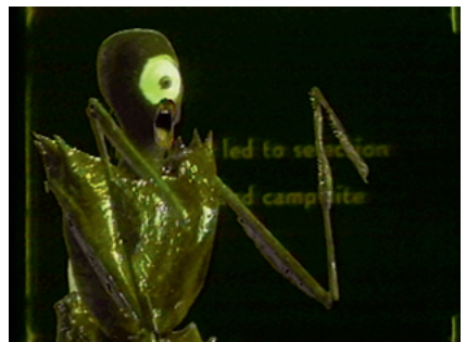
I Want Some Insecticide 1986