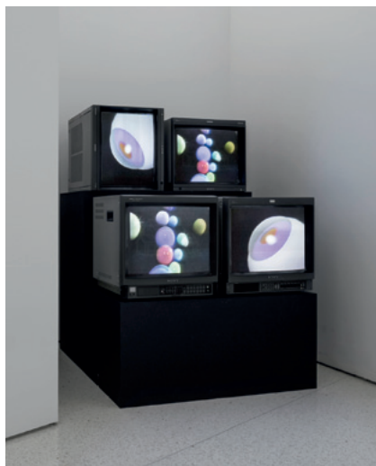
Wild Dead I, II, III (Danceteria Version) 1984 Gretchen Bender

Océ ColourWave print, aluminium frame, 118.9x84.1cm