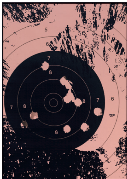
What Other People Think 2017 Georgie Nettell

Single-channel colour video, sound, 6:36 min