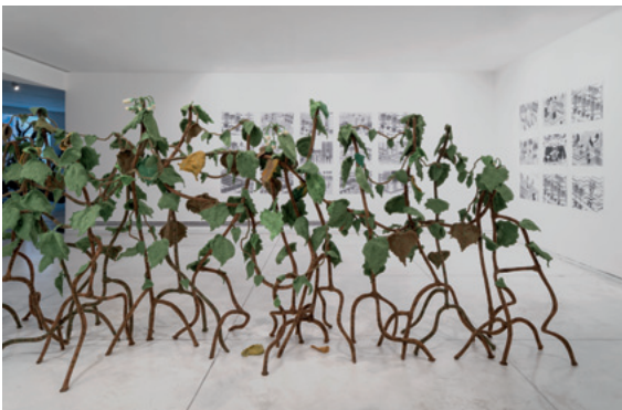
Hedgerow 2018 Gil Yefman and Kuchinate Collective Knitted installation, wool, acrilan, felt, wire, embroidery thread, gas pipes, 250x750 cm Tel Aviv Museum of Art