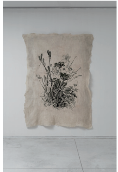
God Full of Wombs 2018 Gil Yefman with Kuchinate Collective Felting, 190x240 cm Tel Aviv Museum of Art