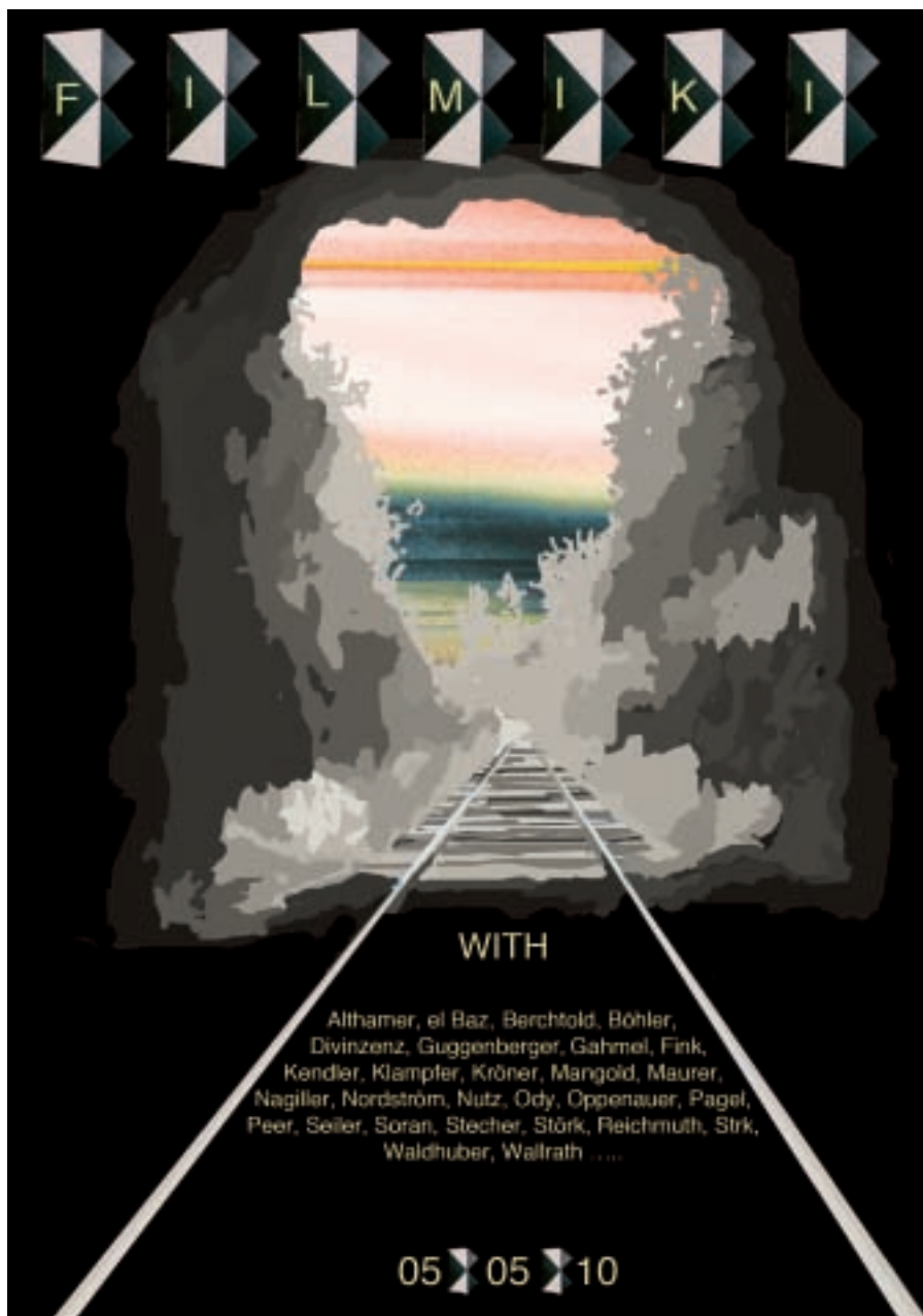
Fabian Störk, Filmiki-Poster , 2010