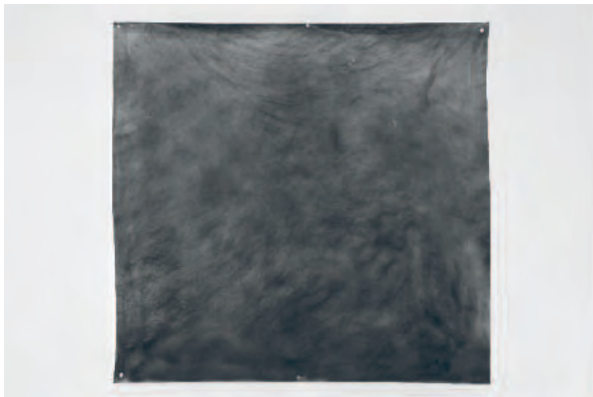
RENATO LEOTTA | TEMPO (Luna del ghiaccio) , 2017 | Silbergelatineabzug / silver gelatin print | 120 x 100 cm | Courtesy: Galeria Madragoa, Lissabon / Lisbon