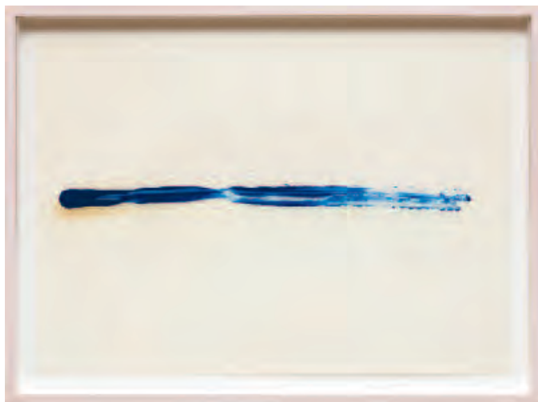
IRMA BLANK | Radical Writings, One way , 1991 | Öl auf Transparentpapier / oil on transparent paper | 25 x 35 cm