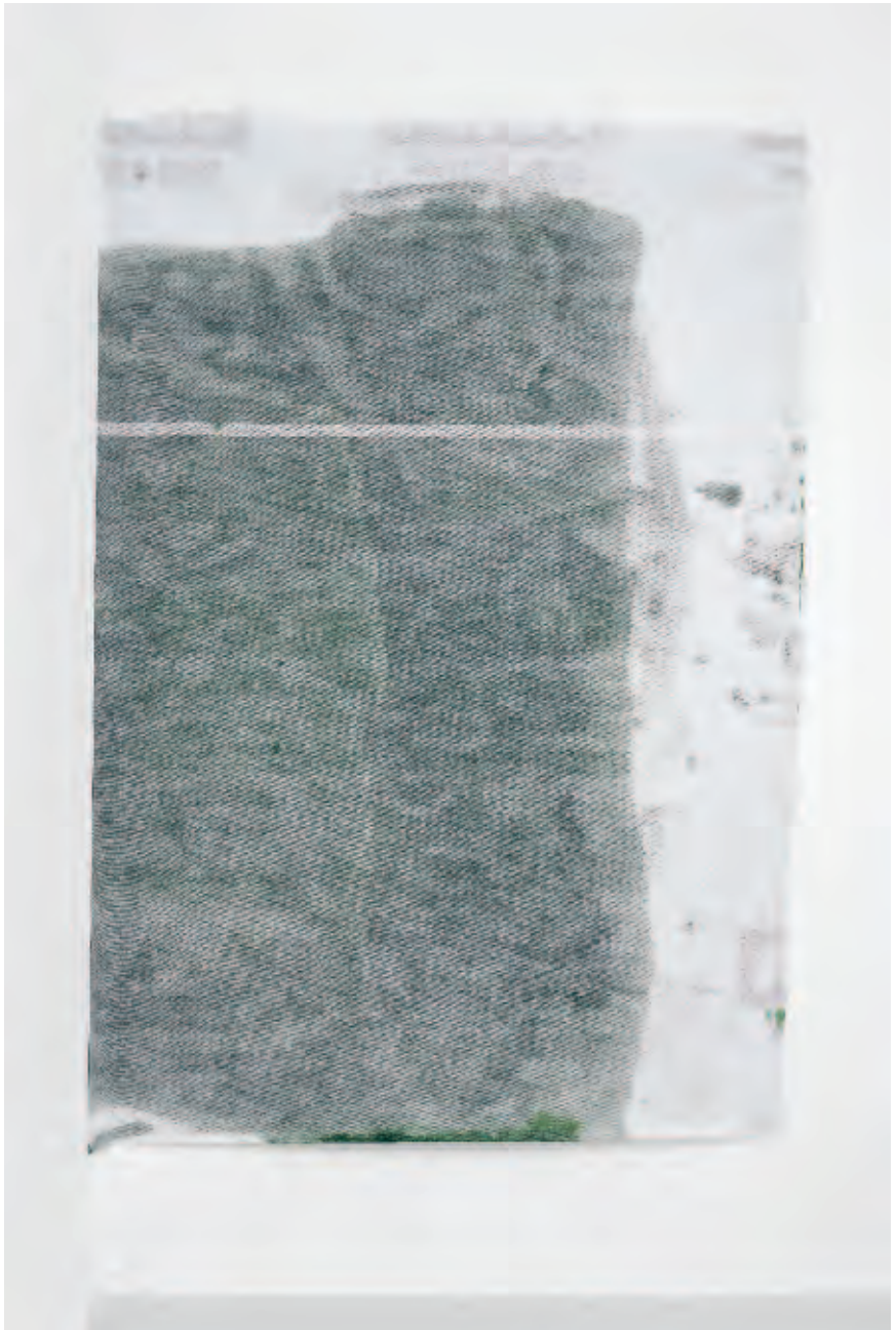
OLVE SANDE | Gusts, Draughts I , 2016 | Ölfarbe auf Windbarriere / oil paint on wind barrier | 223 x 163 cm | Courtesy: Antoine Levi, Paris