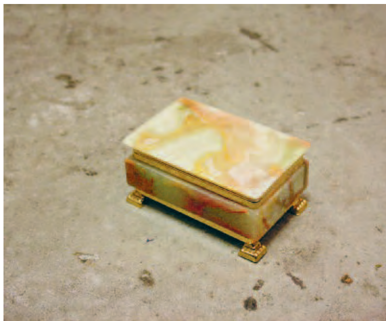
DAVIDE LA MONTAGNA | C3 , 2017 | Schmuckkästchen, Ampulle mit ätherischem Lavendelöl / jewellery box, ampoule filled with lavender essential oil | 11,5 x 7 x 5,5 cm