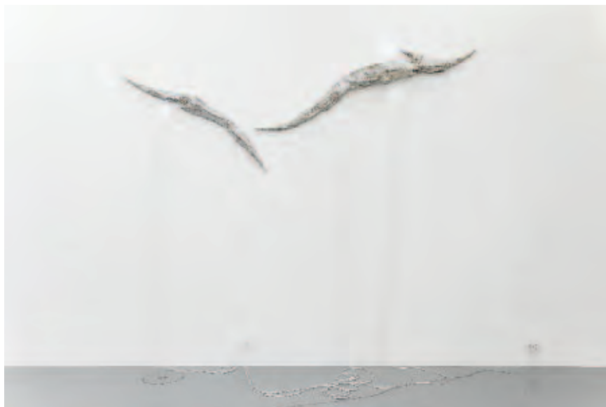
ALESSANDRO AGUDIO | Flashes (Guby & Coca) , 2017 | Holz, Stoff, Harz, Glasfaser, Modellstuck / wood, fabric, resin, glass fiber, stucco for models | 200 x 26 x 18 cm / 287 x 38 x 23 cm | Courtesy: Fanta Spazio, Mailand / Milan