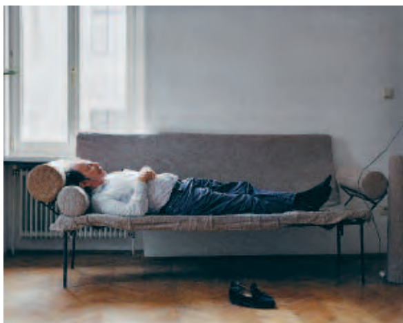
ALBRECHT FUCHS | Franz West, Wien, 2003 | C-Print | 42,5 x 52,5 cm