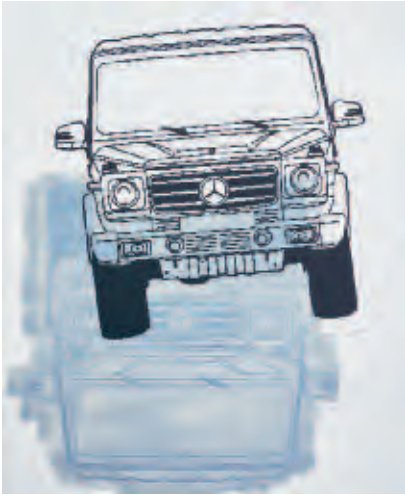
JOHANNES WOHNSEIFER | class & class conflict #4 (intensity of violence) , 2017 | Acryl, Lack, Scotchlite auf Aluminium / acrylic, varnish, Scotchlite on aluminum | 160 x 130 cm | Courtesy: Johannes Wohnseifer, Galerie Elisabeth & Klaus Thoman Innsbruck / Wien