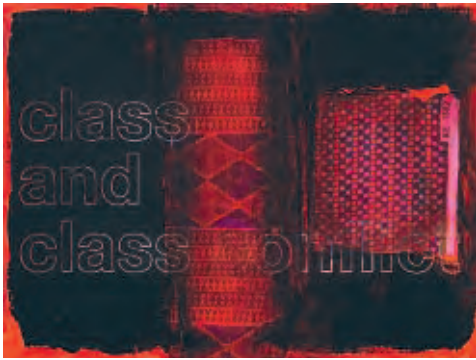
JOHANNES WOHNSEIFER | class & class conflict , 2017 | Acryl, Lack, Lasergravur auf Stoff und Leinwand / acrylic, lacquer, laser engraving on fabric and canvas | 30 x 40 cm | Courtesy: Johannes Wohnseifer, Galerie Elisabeth & Klaus Thoman Innsbruck / Wien