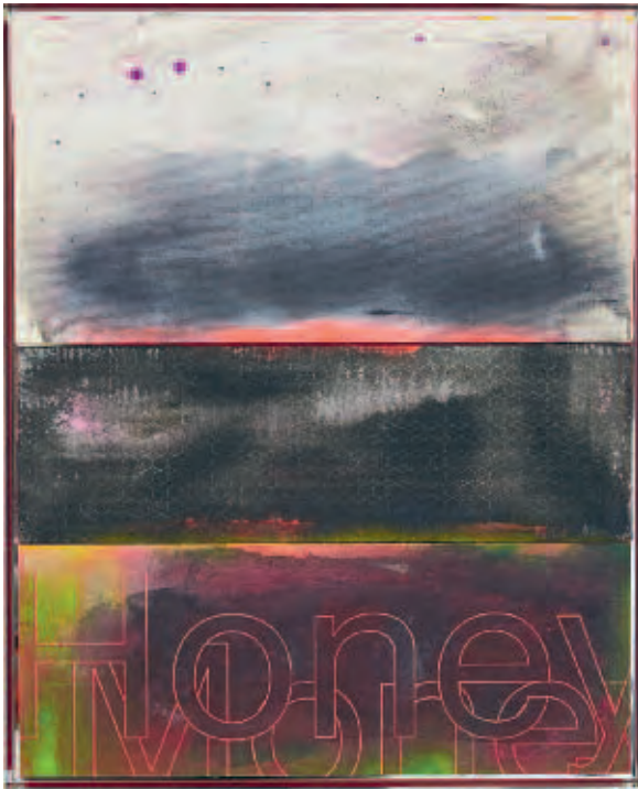
JOHANNES WOHNSEIFER | Colony Collapse Disorder #20 , 2016 | Acryl, Lack, Scotchlite, Lasergravur auf Leinwand, MDF und Filz, spiegelpolierter Edelstahlrahmen / acrylic, varnish, Scotchlite, laser engraving on canvas, MDF and felt, mirror polished stainless steel frame and canvas | 80 x 65 cm | Courtesy: Johannes Wohnseifer, Galerie Elisabeth & Klaus Thoman Innsbruck / Wien