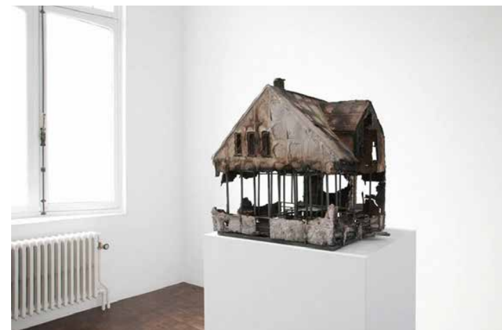
➤ Katrin Sigurdardottir Unbuilt 5—The Residence of Magnús Th. Blöndal, Sólvellir 18, Reykjavík, 2009 Verbranntes Pappmaschee und Holz burned papier maché and wood, 37 × 48 × 43 cm