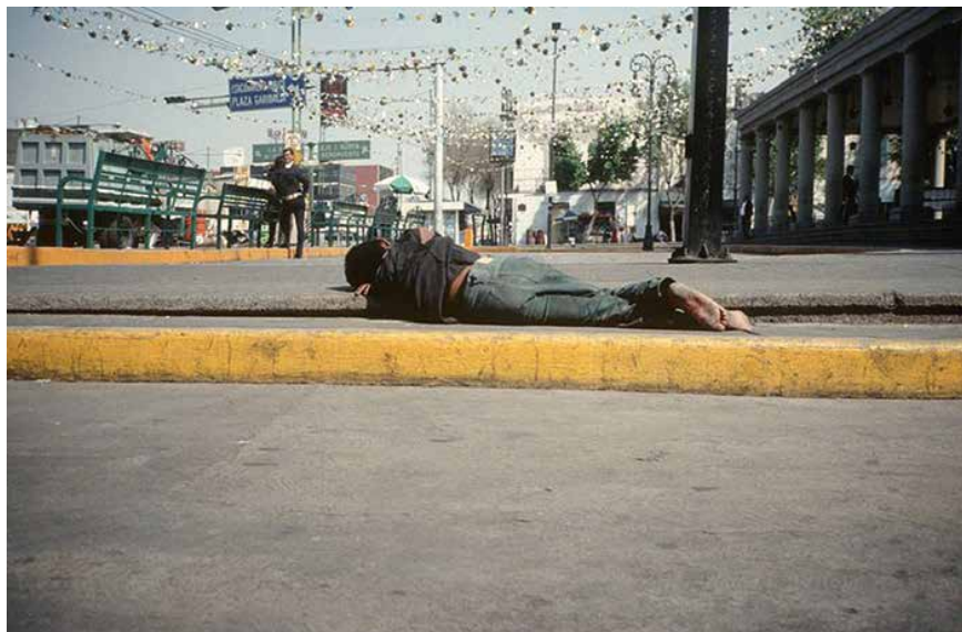
▲ Francis Alÿs, Sleepers IV, 2011 Karussellprojektion von 80 35-mm-Dias 80 35-mm slide carousel projection Courtesy of Galerie Kilchmann © Francis Alÿs