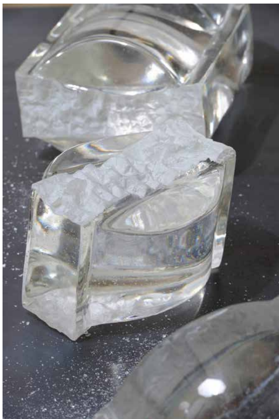
← Jeanne Susplugas Graal, 2013 Kristall crystal, variable Größe dimensions variable © Jeanne Susplugas