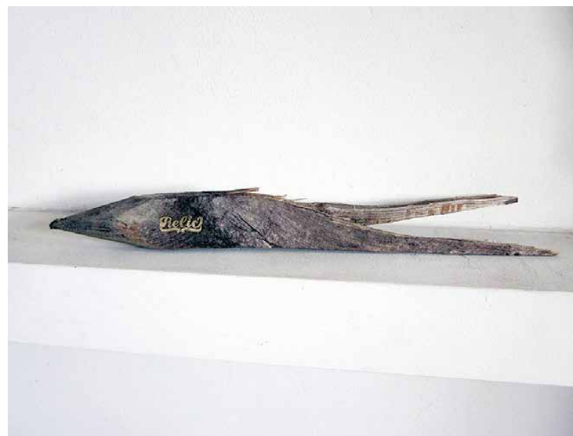
▲ Zipora Fried, Retic, 2012 Holz, Gold wood, gold, 10,2 × 49,5 × 10,2 cm